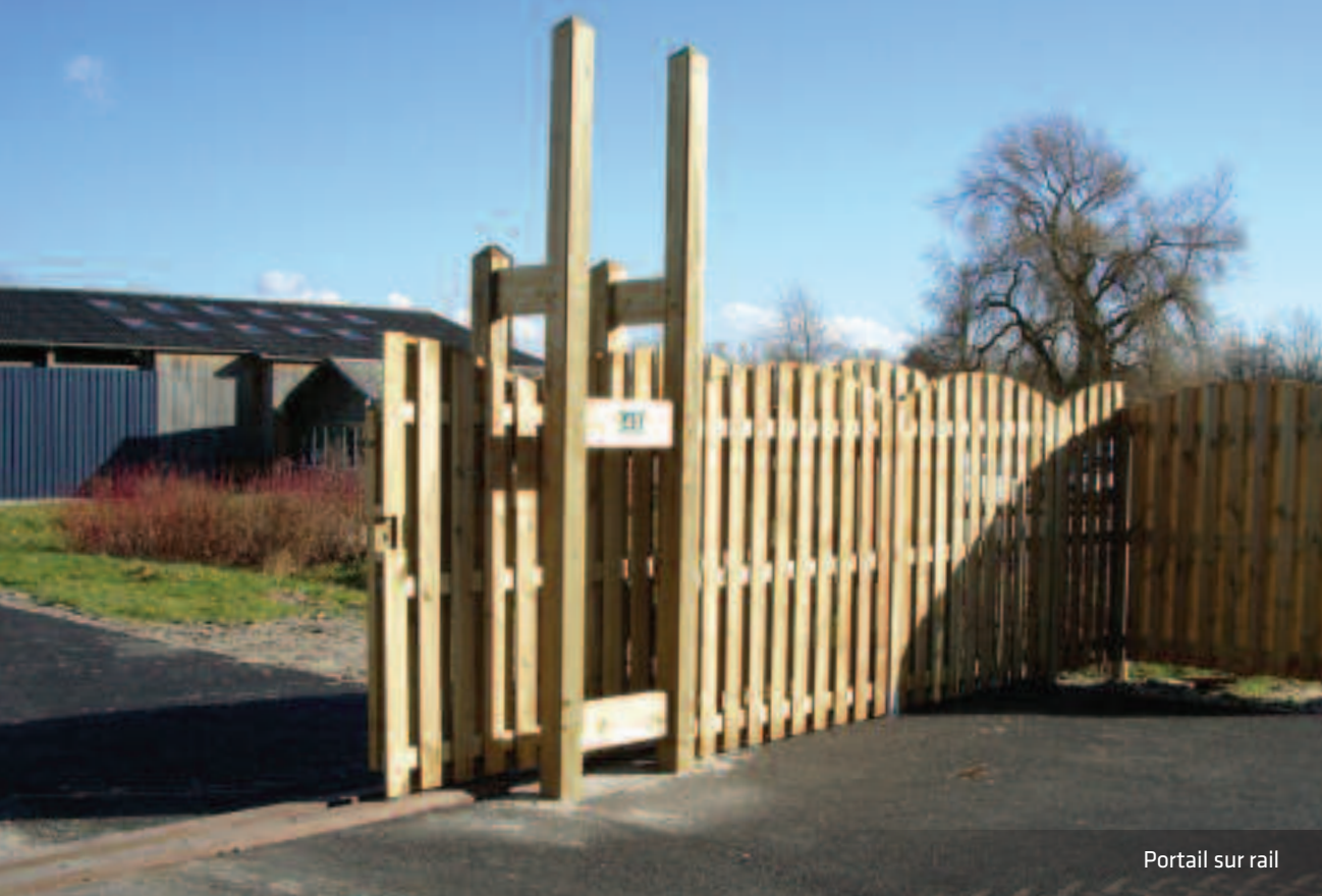
Portail sur rail