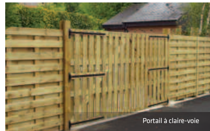
Portail à claire-voie

Conseils techniques et estimations sur demande. Contactez-nous au 03 22 25 02 71 ou par mail : boisplantes@marcanterra.fr