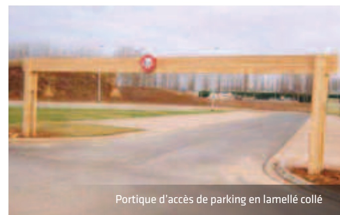
Portique d'accès de parking en lamellé collé