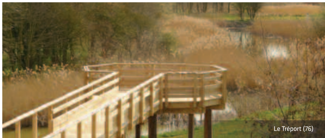
Le Tréport (76)

Conseils techniques et estimations sur demande. Contactez-nous au 03 22 25 02 71 ou par mail : boisplantes@marcanterra.fr