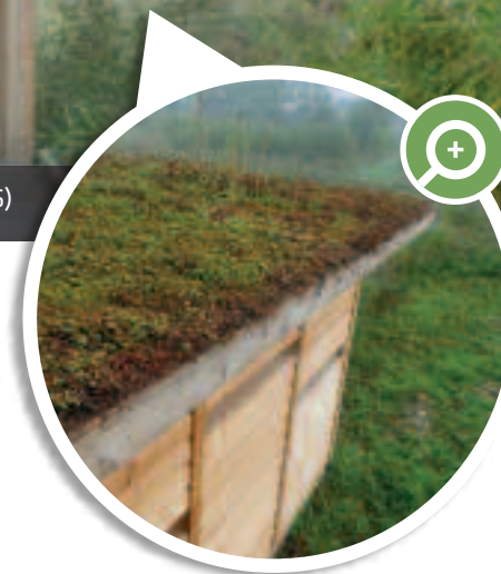
Toiture végétalisée sur demande