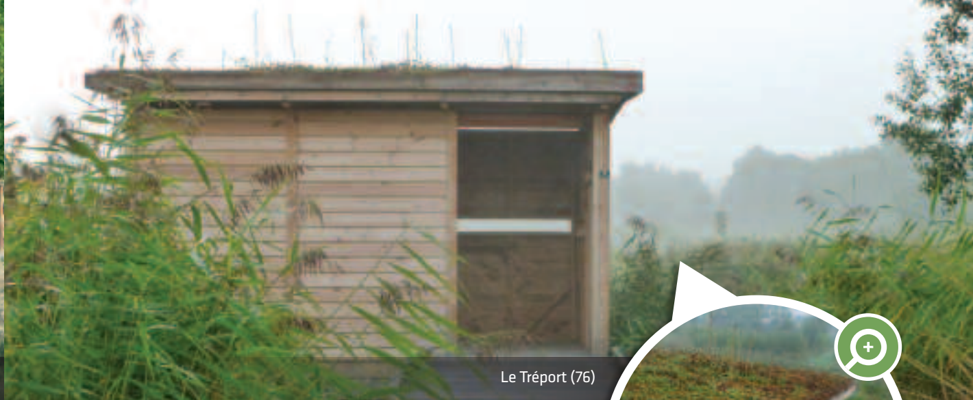
Le Tréport (76)