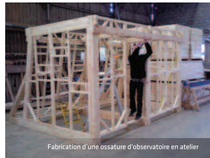
Fabrication d'une ossature d'observatoire en atelier

Retrouvez cette fiche produit sur marcanterra.fr