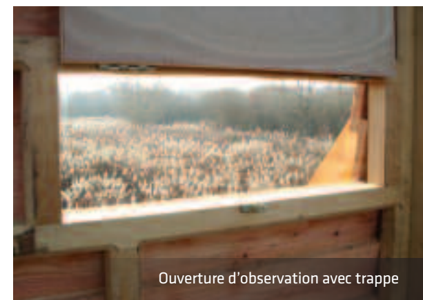
Ouverture d'observation avec trappe