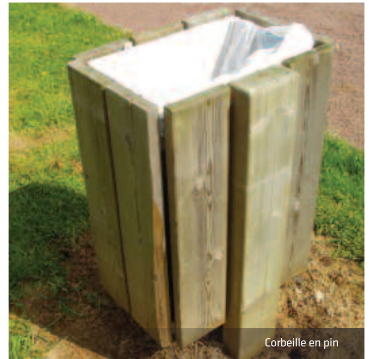
Corbeille en pin

Marcanterra intègre de plus en plus souvent des parties métalliques dans les mobiliers proposés pour des raisons structurelles ou esthétiques.