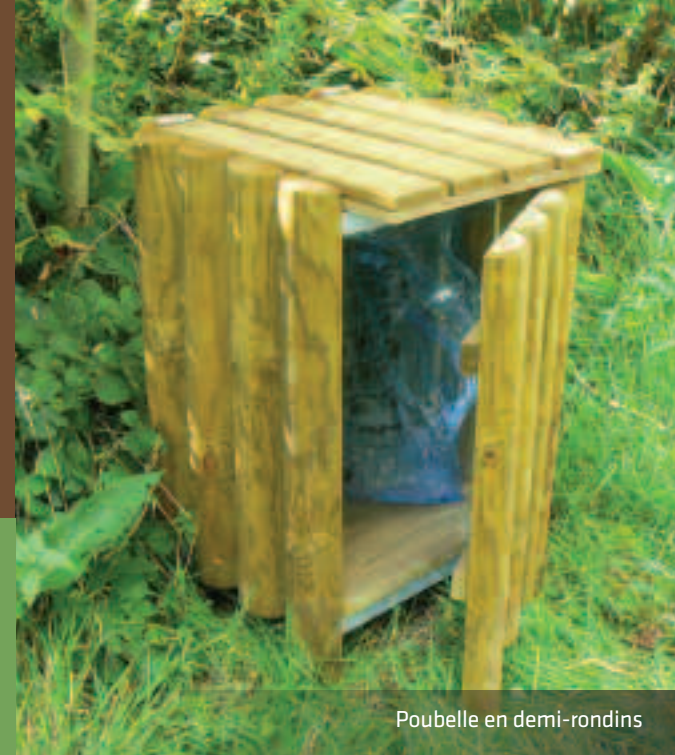
Poubelle en demi-rondins

Conseils techniques et estimations sur demande. Contactez-nous au 03 22 25 02 71 ou par mail : boisplantes@marcanterra.fr