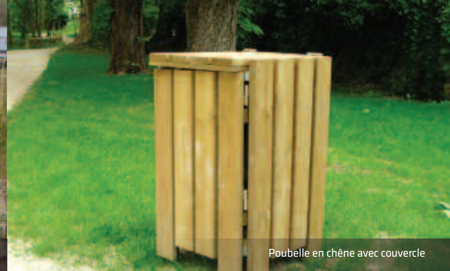
Poubelle en chêne avec couvercle