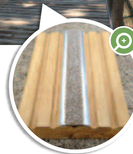
Barrettes antidérapantes RugoPlat® Profilé aluminium anodisé avec résine époxy chargée en corindon