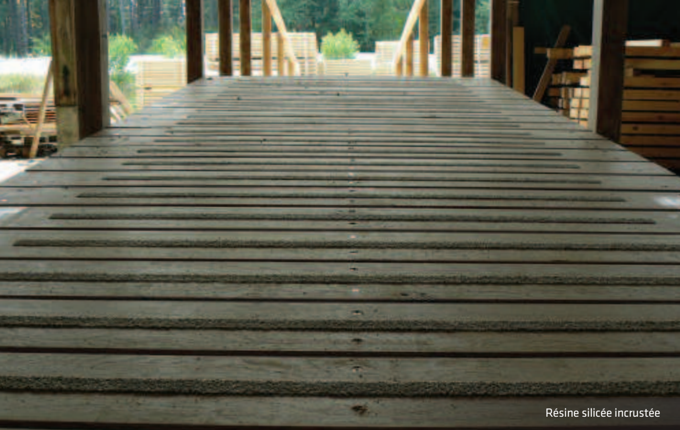
Résine silicée incrustée