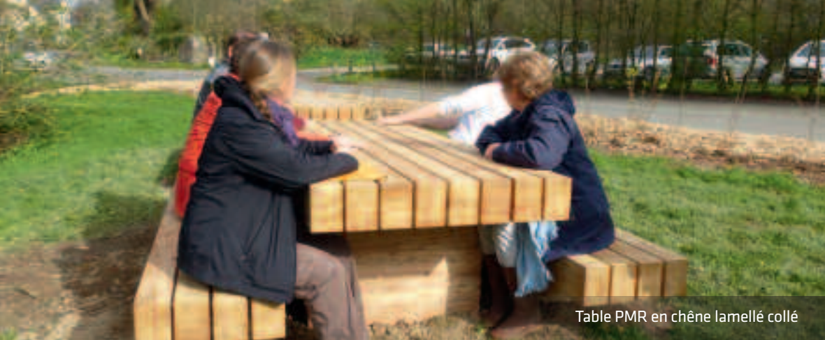
Table PMR en chêne lamellé collé