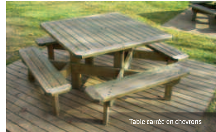
Table carrée en chevrons